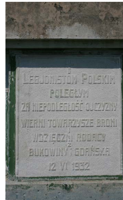
3. Tablica na pomniku legionowym na cmentarzu w Rarańczy (Ukraina).

Nadwórnej, Pasiecznej, Zielonej 22 , Czerniowcach i Rarańczy oraz kamienne krzyże w tej ostatniej miejscowości. Rolę komemoratywną odgrywają wreszcie samotne krzyże i tablice pamiątkowe: krzyż na Przełęczy Legionów (1914, odtwarzany w latach 1924 i 1931) 23 , tablica w kościele Jezuitów w Czerniowcach (umieszczona po 1945) 24 , a także upamiętnienia znacznie późniejsze, jak w Rokitnie (2015). Funkcję taką pełni wreszcie pojedyncze pomniki nagrobne w Rumunii – jak w Kirlibabie (pierwotny z 1932, po 2000 r. odnowiony) 25 czy krzyż-kapliczka w Berbești 26 (d. Bárdfalva, 2014) ustawiony staraniem i kosztem miejscowego historyka dr. Laurentiu Batina (il. 4).