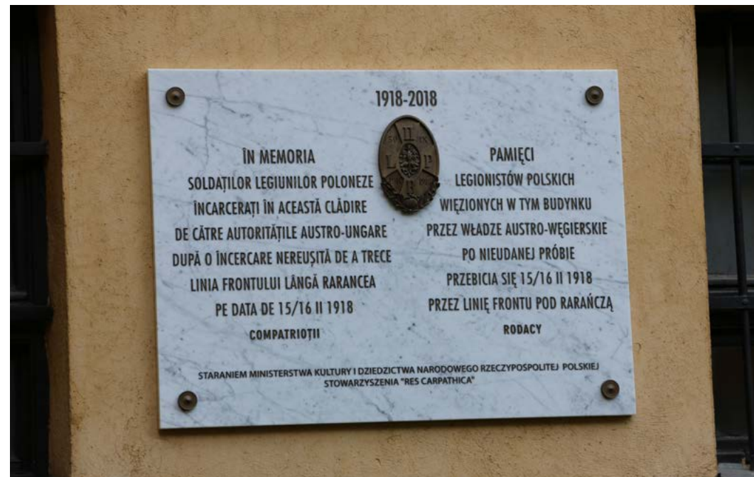
5. Tablica upamiętniająca uwięzienie legionistów polskich w Muzeum Memorialu w Syhocie Marmaroskim (Rumunia).

datkowe tablice m.in. z nazwiskami poległych przy pomnikach w Rafajłowej i Mołotkowie zainstalowane w 2015 r. oraz tablica w Muzeum Miejsce Pamięci Ofiar Komunizmu i Ruchu Oporu „Memorialu” w Syhocie Marmaroskim (Rumunia) w 2018 r. 28 (il. 5),