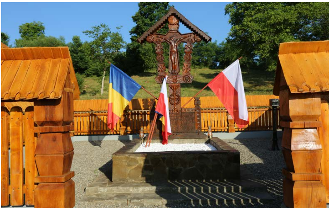
4. Drewniany krzyż w formie kapliczki na grobie legionistów polskich w Berbești (Rumunia).

Jednocześnie cmentarze wraz z pomnikami legionowymi i poświęconymi polem oddzielnymi tablicami stanowią znaki pamięci: