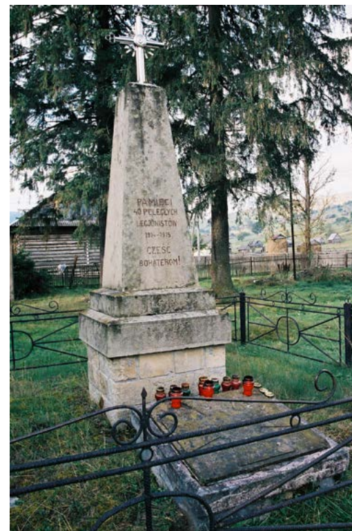
2. Pomnik Legionistów w Rafajłowej (Ukraina).

Śladami tych zmagania i wydarzeń są cmentarze legionowe i pomniki w Ukrainie – w Rafajłowej (1920, z dodatkowymi tablicami na pulpitych podstawach z 2015) 18 (il. 2), w Dolinie Płajskiej (Holzschlaghaus) 19 , pomniki i kwatery legionowe na miejscowych cmentarzach w Rarańczy (1932) 20 (il. 3) i w Kołomyi (znajdujący się tam tzw. pomnik legionistów, bo otoczony ich nagrobkami, został faktycznie wzniesiony w latach I wojny światowej dla poległych żołnierzy austriackich; można dodać, że takimi byli też z racji podlegania austriackiej komendzie i polscy legionieści) 21 . Należy wymienić też pomniki legionowe z lat międzywojennych na cmentarzach w Stanisławowie (Iwano-Frankiwsk), Bohorodczanach, Sołotwinie, Mołotkowie,