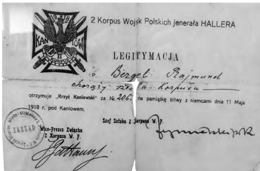
Legitymacja „Krzyża Kaniowskiego” nr 2061; ze zb. Muzeum Niepodległości w Myślenicach.

Ukończył przerwane studia i objął posadę nauczyciela w państwowym gimnazjum w Gorlicach. Jako nauczyciel rzeczywisty został przeniesiony od 1 września 1928 r. do gimnazjum w Myślenicach, rozporządzeniem Ministerstwa Wyznań Religijnych i Oświecenia Publicznego z 21 maja 1928 r. (L. II. 7438/28) oraz rozporządzeniem Kuratorium Okręgu Szkolnego Krakowskiego z 6 czerwca 1928 r. (L. II. 6302/28) 9 . Uczył języka polskiego oraz propedeutyki filozofii. Na podstawie art. 8 Ustawy z 1 lipca 1926 r. uzyskał z dniem 1 grudnia 1927 r. tzw. ustalenie na stanowisku nauczyciela, rozporządzeniem Kuratorium O. S. Kr. z 21 października 1929 r. (Nr. II. 11770/29) 10 . Już wtedy dawała o sobie znać nieuleczalna choroba. W pierwszym półroczu roku szkolnego 1930/31 uzyskał zniżenie obowiązującego wymiaru godzin do połowy (rozp. Kur. O. S. Kr. z 16 lipca 1930, L. II. 7567/30), a w drugim półroczu pozostawał na płatnym urlopie dla poratowania zdrowia, usankcjonowanym rozporządzeniem Kuratorium O. S. Kr. z 21 stycznia 1931 r. (L. II. 583/31) 11 .