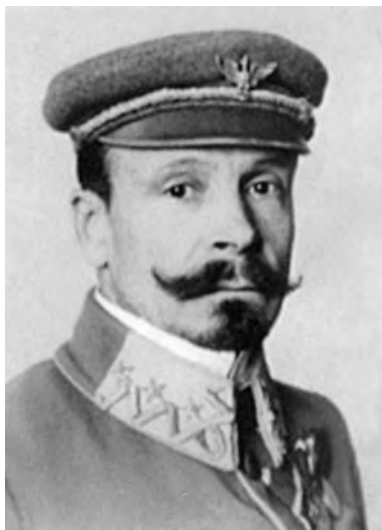
Brygadier Józef Haller