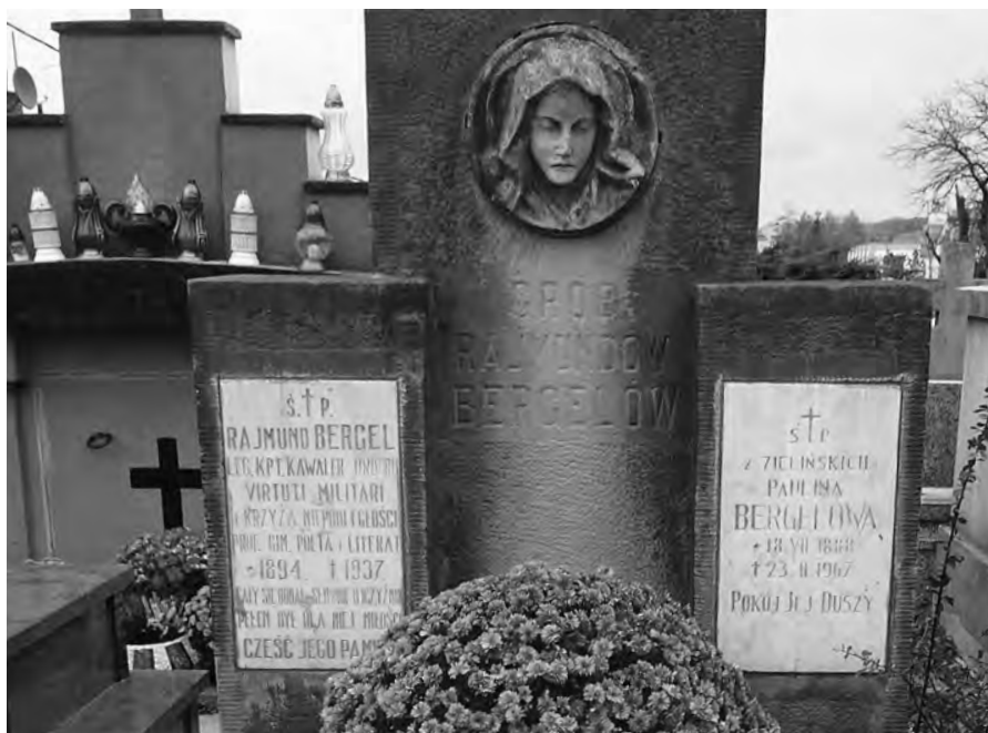
Grób rodziny Rajmundów Bergelów na Starym Cmentarzu w Myślenicach

„Kochanym Wujciem” – pisał Rajmund Bergel na kartach legionowej poczty polowej ( Feldpostkarte ). W listach informował o swojej twórczości, przysyłał wydawcom za pośrednictwem Wujostwa swoje poezje, wysyłał również – na wszelki wypadek – kopie ważniejszych utworów. Oto próbka listu z 12 lutego 1917 r.: