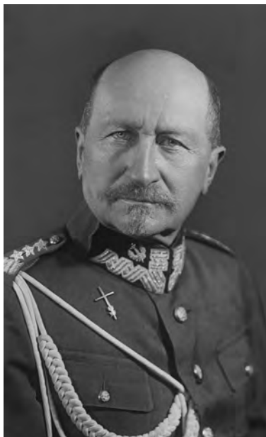
Gen. Józef Dowbór–Muśnicki

Powołując się na dane przedstawione przez gen. Józefa Dowbór–Muśnickiego 24 w pracy pt. Szkic do dziejów I Korpusu , a także referat Jerzego Zdziechowieckiego 25 pt. O polskiej sile zbrojnej , wygłoszony na zebraniu Klubu Narodowego w Piotrogradzie 13 kwietnia 1917 r., szacował liczbę Polaków w wojsku rosyjskim na maksymalnie 500 tysięcy żołnierzy, mających już za sobą co najmniej trzy lata służby, ale żołnierza liniowego w piechocie stosunkowo bardzo mało i to przeważnie z roczników młodszych 26 , w tym oficerów Polaków ok. 19 tysięcy i niewiele ponad stu generałów, którzy stanowili również w służbie frontowej znikomą procent 27 . Niestety, w morzu ogólnej anarchii zaistniałej po wybuchu rewolucji bolszewickiej, mimo korzystnych momentów w przeznaczonych do polonizacji oddziałach, zaprzeczono możliwość utworzenia jednej polskiej armii. Powstawały natomiast nieliczne jednostki wojskowe, np. I Korpus w Bobrujsku i Mińsku, II w Sorokach, III w Winnicy, czy wręcz różnorakie załogi milicji dworskich i miejskich, łatwo na ogół rozbrajane i rozpuszczane.